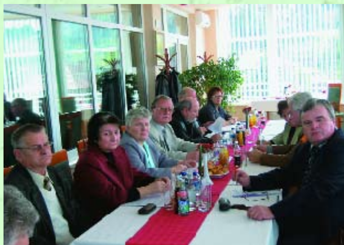
Az egyesület tagjai