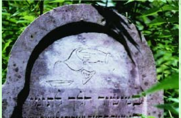
Lévita jelkép Somogyszil

Tárulhasson fel közös múltunknak ez a része, tárulhasson fel a történelem már-már elfelejtett lapja! Legyen egyértelmű mindenki számára, hogy a nemzetet alkotó népek közül volt itt egy a Kárpát –medencében, amelyből 600 ezer pusztulása után alig maradtak, s amely jelenében és múltjában mégis élni akar.”