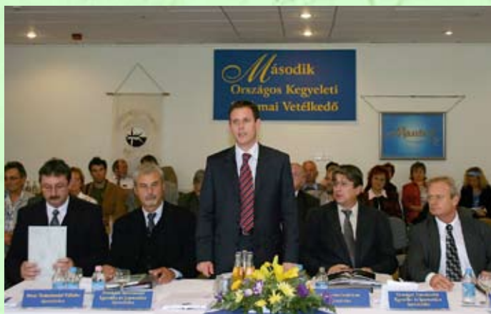
A II. Országos Kegyeleti Szakmai Vetélkedő zsűrije, Pécs, 2005. október 1-2.