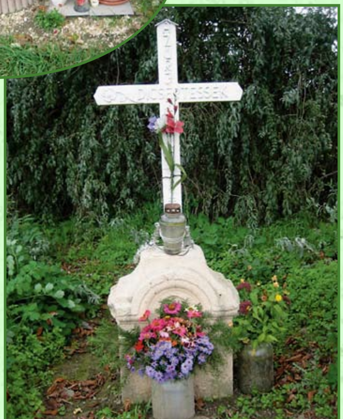
A Győr és Baranya menti utak síremlékeiről a fotókat Puskás Béla készítette.