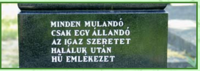
Szöveg és fotó: Dr. Balázs Kovács Sándor