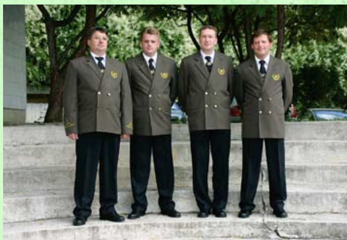
A Vas-megyei Temetkezési Vállalat (Szombathely) csapata 219 ponttal nyerte el az első helyezést a 2005. vetélkedőn