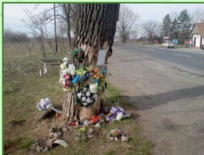
Szöveg és fotó: Varga József

Az idő múlásával a sírjelek látogatása is egyre ritkul, arra is van példa, hogy az állandó, kőből készült haláljellet sem látogatják már a hozzátartozók.