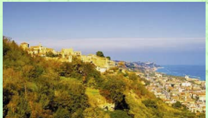
Összeállította: Puskás Béla

Egyedülálló szerencsejátékot indítottak egy olaszországi város illetékesei. A Campania régióban, Nápolytól 9 kilométerre fekvő Marano lakosai mostantól némi szerencsével végső nyughelyet nyerhetnek. A kisváros temetőjében ugyanis elfogyott a hely, így a hatóságok kénytelenek voltak egy új, "sürgősségi" temetőt létrehozni. A mentőötlet egyetlen hibája, hogy csak 48 sírhelyet kínál, hiába lenne sokkal többre igény, ezért a városka vezetői attól tartanak, hogy a lakosok megpróbálják "megkenni" az illetékeseket. Megoldásként, hogy korrupció nélkül oszthassák ki a sírhelyeket, előálltak a lottószelvény árusításának ötletével. A nyertes lottószelvényt birtokló családoknak így biztosan lesz sírhelyük.