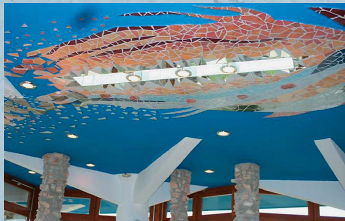
A ravatalozó díszes menyezete