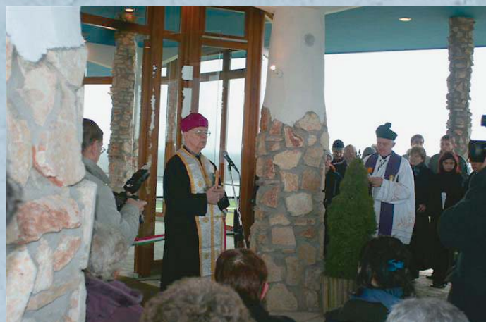
Az egyház képviselői is felszentelték a ravatalozót

A tervező a környék ősi hagyományait is figyelembe vette, ugyanis a ravatalozó épületét egy kunhalomra helyezte, a kiszolgáló és szociális egységeket, hűtőket és egy liftet a kunhalom belsejében valósította meg. A kunhalom még a