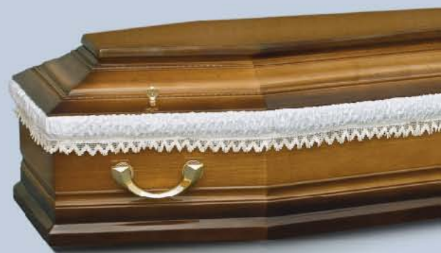
mod. Terra Gold