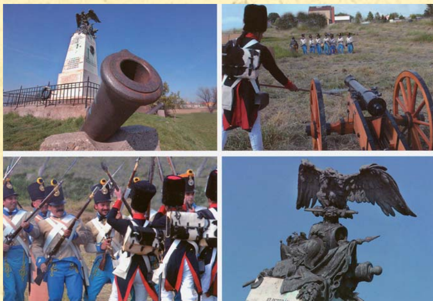
Csatajelenetek bemutatása a 2006.ban tartott megemlékezésen