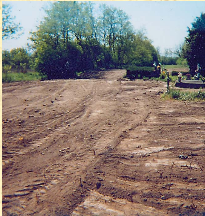
Szöveg és kép: Puskás Béla