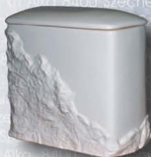
Dráva szikla (kerámia)

Új exclusive koporsóink egyike a "Rózsagyökér brill"