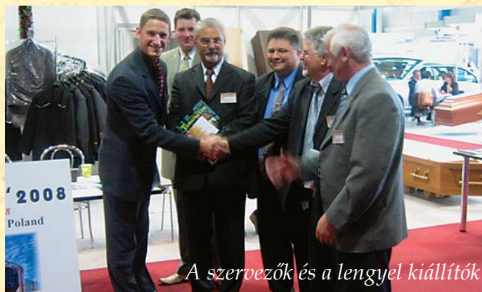
A szervezők és a lengyel kiállítók