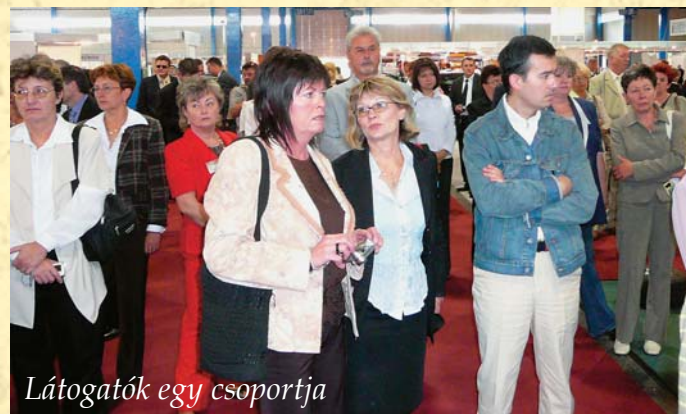
Látogatók egy csoportja