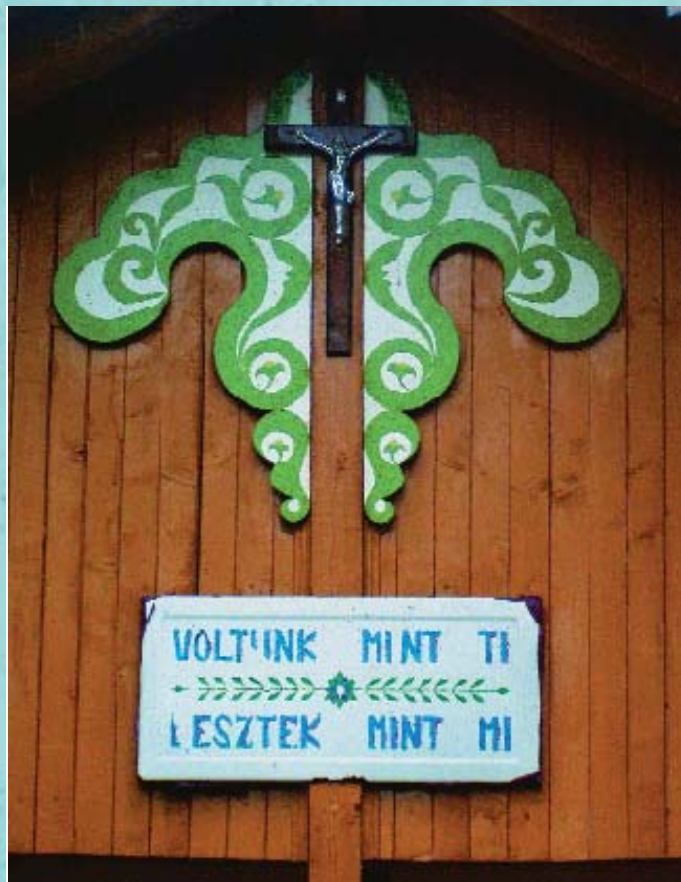
A kásádi temető jellegzetes síremléke Egy sír, melyet a hála a szeretet és a kegyelet virágai borítanak