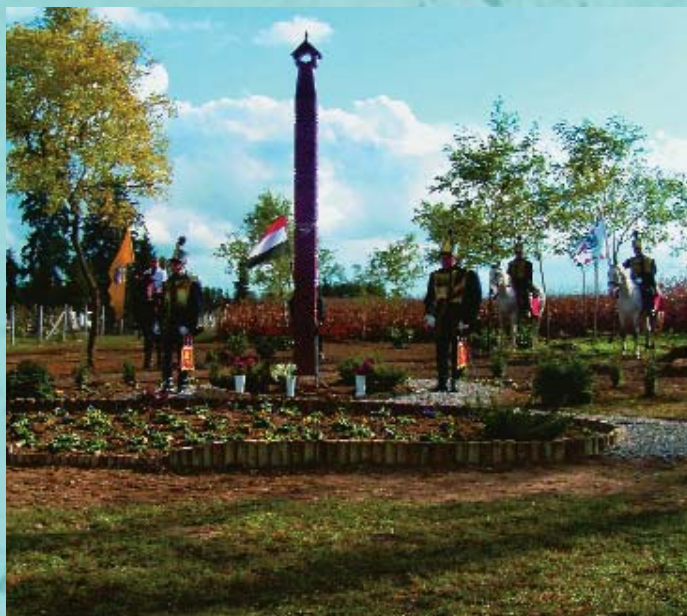
Kopjafát állítottak Várdán az '56-os áldozatok emlékére