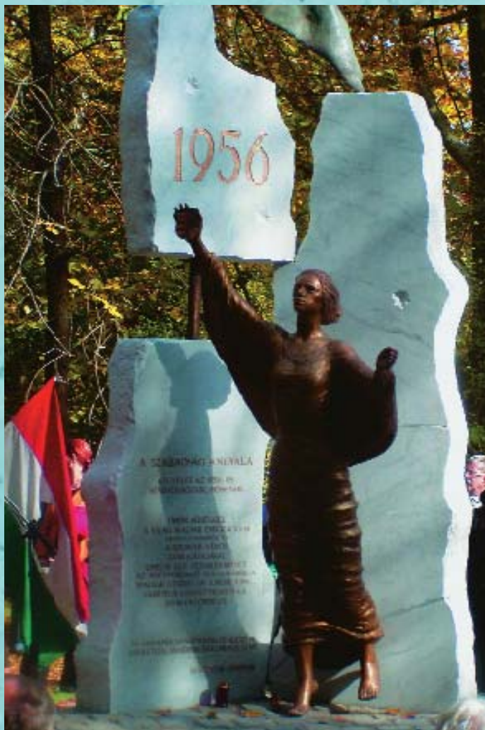
Emlékezés a hősökre - a Szabadság anyala Kaposvárott