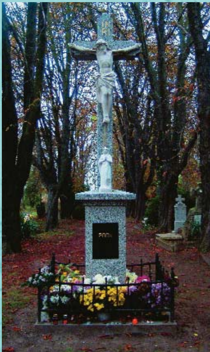
Krisztus-kereszt a beremendi temetőben halottak napján