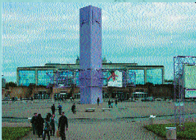
„Külsőre egy kicsit többet vártam volna egy francia kiállítócsarnoktól”

Minden második évben rendezik meg a franciaországi Lyonban a Funexpo kiállítást, amely fontosságát tekintve „csak” a második rendezvény Franciaországban. A kiállítás szervező társaság a Francia Temetkezési Vállalkozások Szövetségével (FFPF) karöltve rendez szakkiállítást, páratlan években Párizsban, páros években Lyonban.