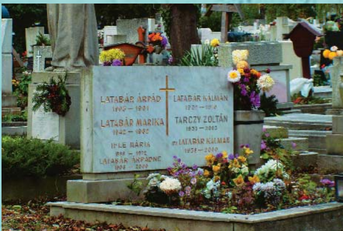
Latabár Árpád (1903-1961) és Latabár Kálmán (1902 - 1970) színész