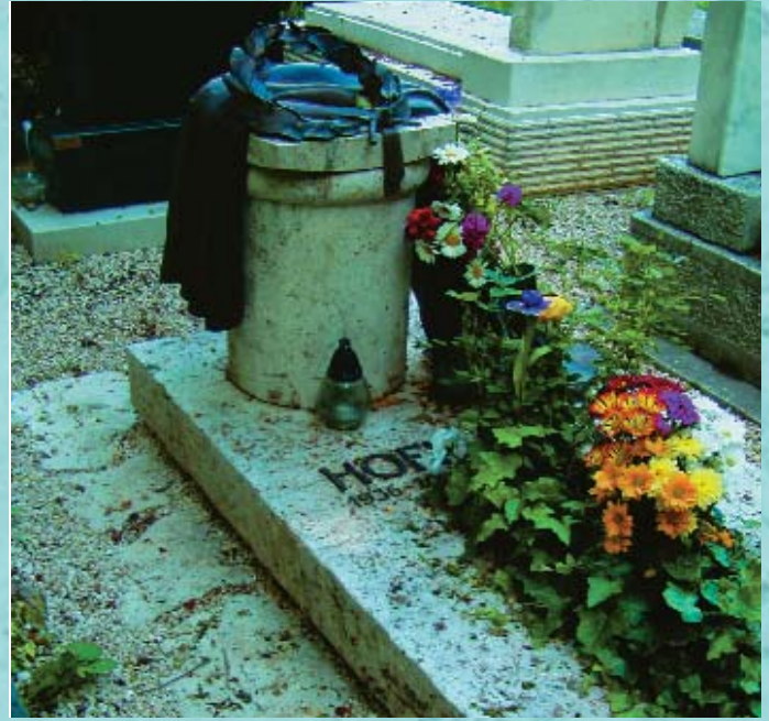
Hofi Géza (1936-2002) humorista