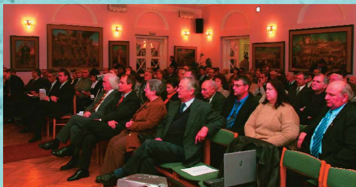
A konferencia hallgatói