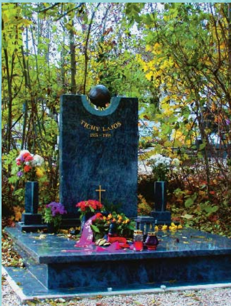
Tichy Lajos 1935-1999 labdarúgó