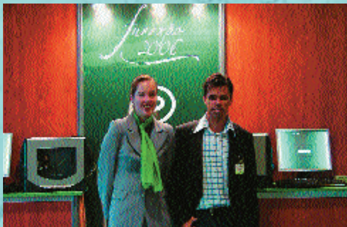
„A francia hostesslány, aki segédkezett a Temexpo anyagok kiosztásában”