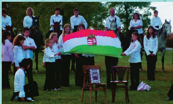
A fiatalság méltóképpen emlékezett a hősökre