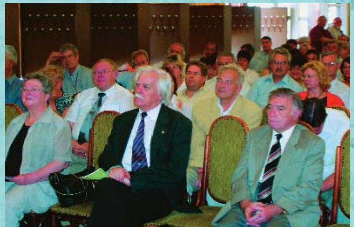
A 2005-ös konferencia nagy érdeklődést váltott ki a szakmában

A jövő évi konferenciánk Budapesten lesz az OTEI szakkiállításával egy időben és egy helyen. Ott szeretnénk beszámolni a szervezet meglévő, és tervezett tevékenységéről, valamint a többi országos szervezettel való közös munkánkról.