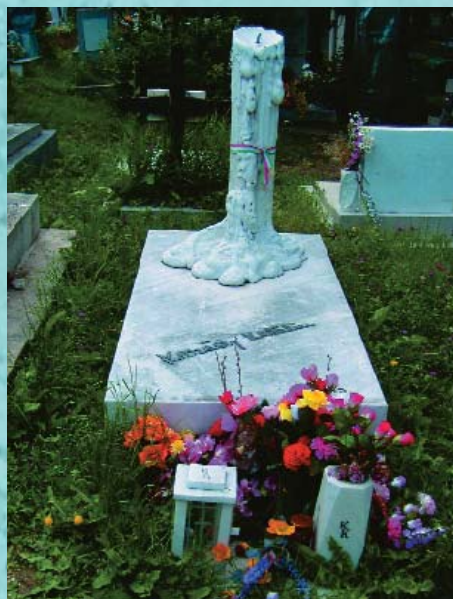
Karády Katalin (1910-1990) színésznő