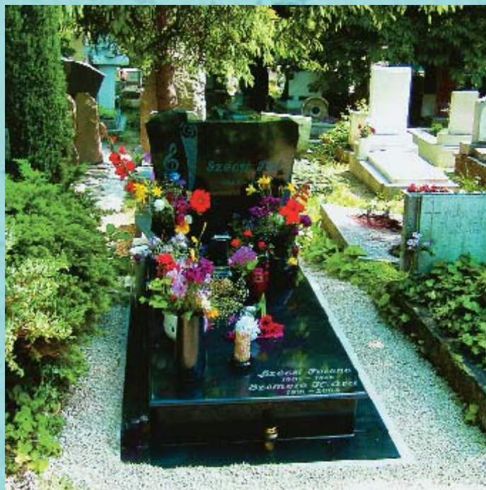
Szécsi Pál (1944-1974) énekes