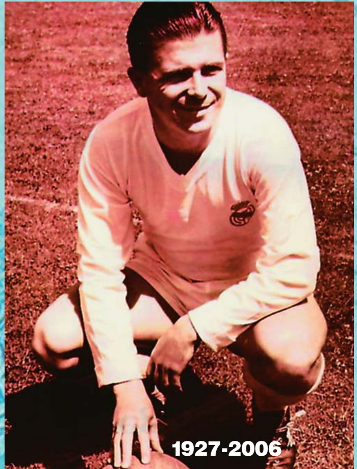
Elhunyt Puskás Ferenc világhírű labdarúgónk, aki már életében legenda volt