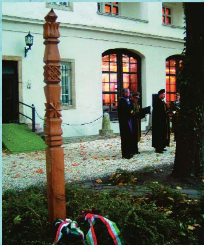
Kopjafát avattak a Hadtörténeti Múzeum és Levéltár udvarán is