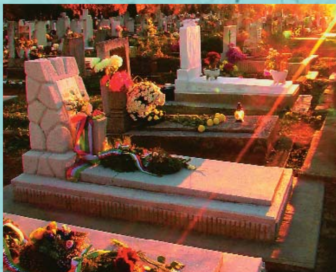
Az emlékezés fényei a kaposvári temetőben