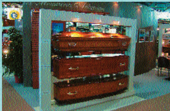
„Az említett helytakarékos ugyanakkor nagyon igényes bemutatóállványok”