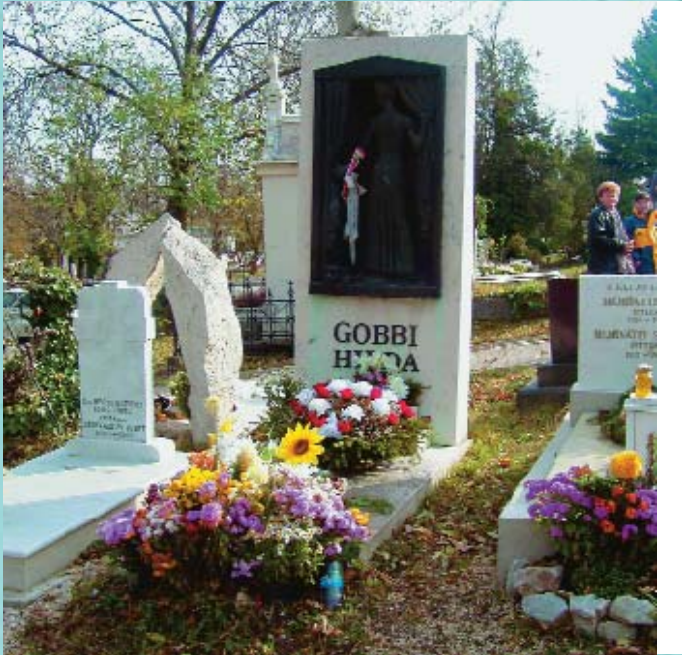
Gobbí Hilda (1913-1988) színésznő