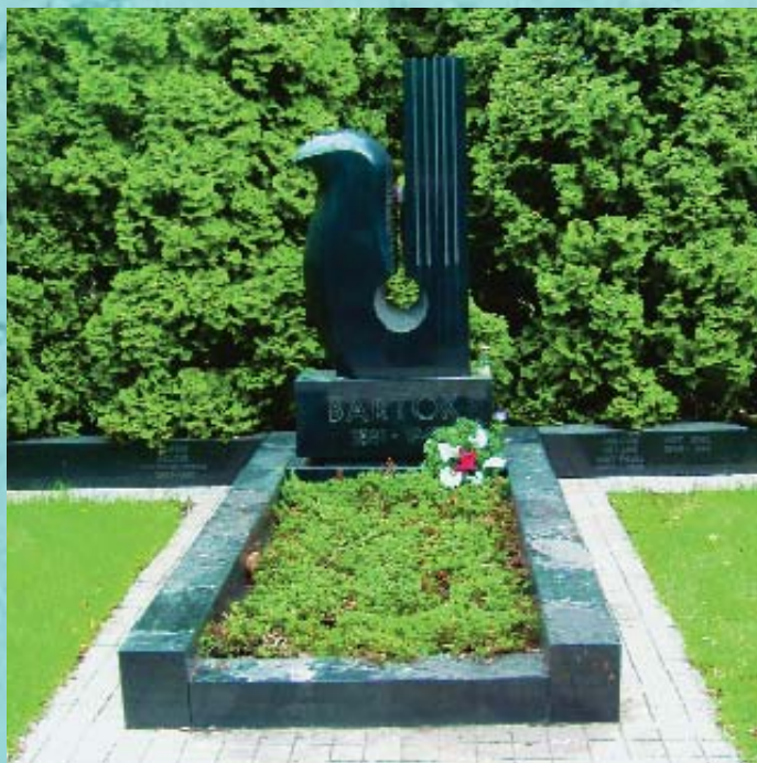
Bartók Béla (1881-1945) zeneszerző