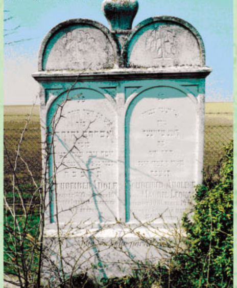
A bácsalmási zsidó sírkert XII. számú ún. „turbános” síremléke