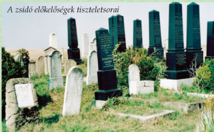
A zsidó előkelőségek tiszteletsorai

sorokat” nyitottak, amelyek ma is jól láthatók. A sírfeliratok nagyon gazdagok és szépek. A jelképek (szimbolikák) közül az I. sírsorban az apai ágon papi családból származó férfiak (kohaniták) temetkeztek. Jelképük: az áldást osztó két kéz, (az ún. kohanita kéz). Gyakoriságában ezt követi a