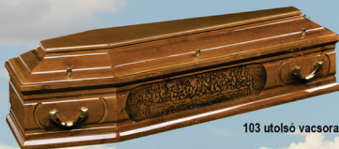
103 utolsó vacsora