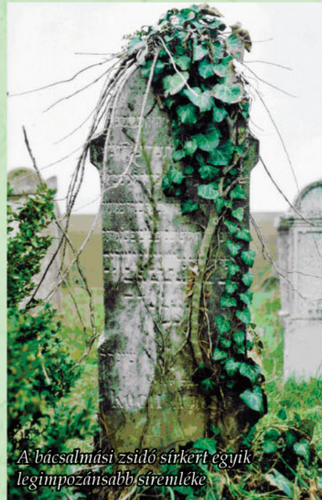
A bácsalmási zsidó sírkert egyik legimpozánsabb síremléke

sorokat” nyitottak, amelyek ma is jól láthatók. A sírfeliratok nagyon gazdagok és szépek. A jelképek (szimbolikák) közül az I. sírsorban az apai ágon papi családból származó férfiak (kohaniták) temetkeztek. Jelképük: az áldást osztó két kéz, (az ún. kohanita kéz). Gyakoriságában ezt követi a